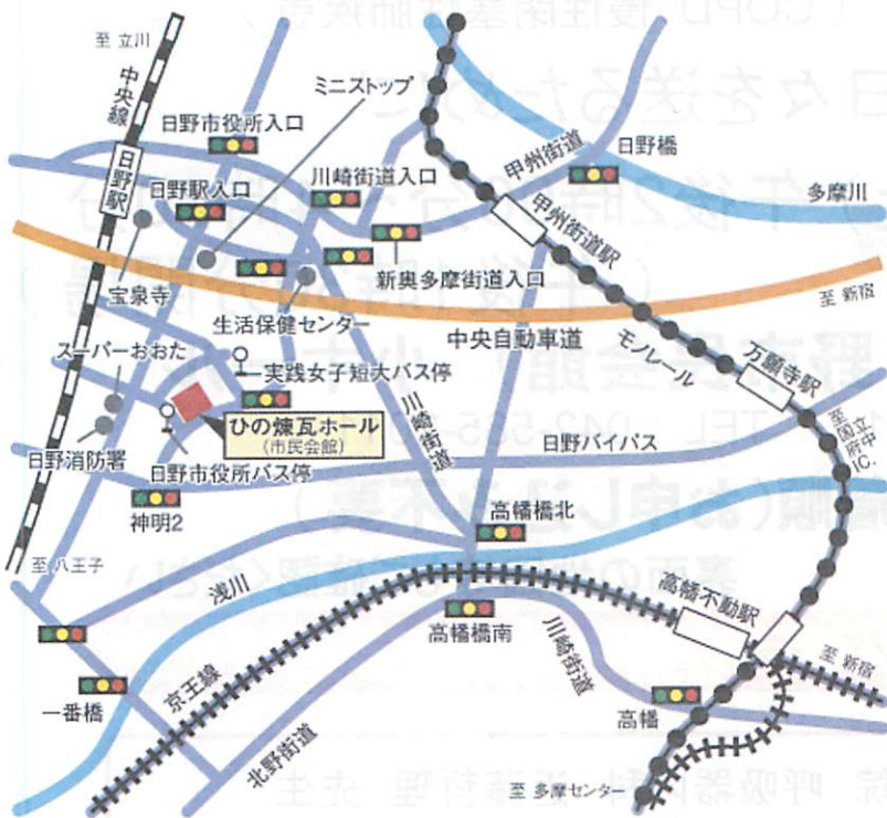
市民会館周辺公共駐車場案内図

JR中央線日野駅(5番のりばから京王バス「日03」系統 実践女子短大経由高幡不動駅行き)に乗り、実践女子短大バス停で下車、京王線、多摩モノレール高幡不動駅(2番のりば(ドールコーヒーの前)から京王バス「日03」系統 実践女子短大経由日野駅行き)に乗り、実践女子短大バス停で下車です)からはバスもあります。そのほか市内ミニバスも運行しています(日野市役所もしくは実践女子短大下車)。